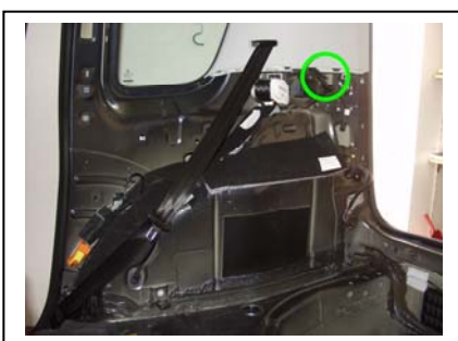
Durchführung Heckleuchte rechts