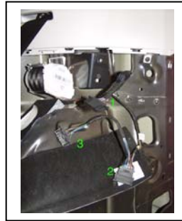
Steckverbinder D-Säule links