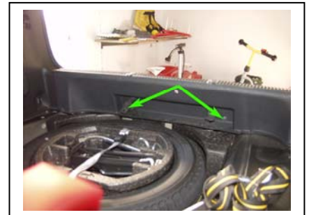
Befestigung Abdeckung Heckblech